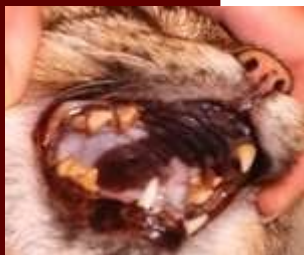
Kat met tandsteen

Daarnaast is de dierpas te gebruiken als spaarkaart, en dat biedt voor u als klant zeer aantrekkelijke mogelijkheden!