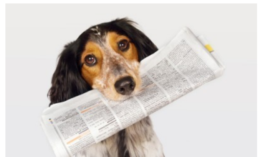
Nieuws voor u!

Wij hopen dat u deze gratis dienst waardeert en wensen u veel leesplezier.