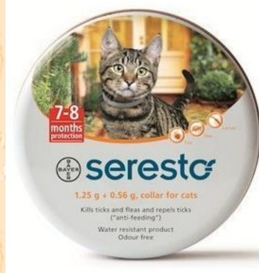
Tekenband voor de kat.

Voor uw smartphone kunt u een gratis app downloaden die u ook informatie geeft over de verspreiding en het risico van tekenbeten. Te downloaden op www.tekenalarm.info