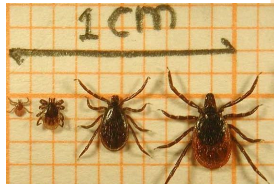
Van links naar rechts de larve, nimf, mannetje en het vrouwtje van de schapenteek

-Verwijder teken die al vastzitten met een tekenpincet. Zet het bekje van de pincet op de teek, zo dicht mogelijk bij de huid, en draai dan de pincet rond tot de teek loslaat. Desinfecteer de beetplaats. Verwijderen voordat de teek is volgezogen verkleint het risico op infecties sterk.